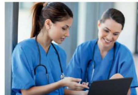
Servizi per la Sanità e l'Assistenza Sociale