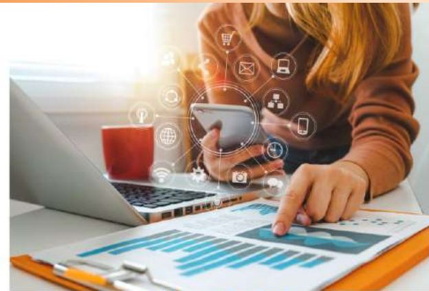
ECONOMICO Amministrazione, Finanza e Marketing