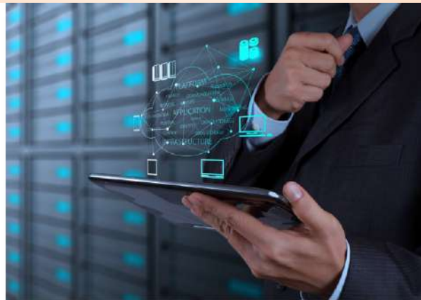
ECONOMICO Sistemi Informativi Aziendali